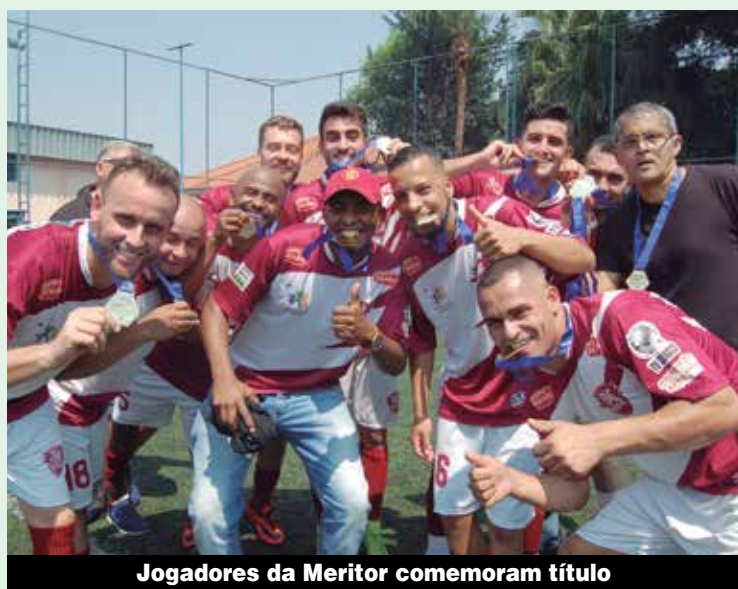
Jogadores da Meritor comemoram título

“Acreditamos na vitória. No ano passado, chegamos bem próximos. Neste ano focamos, montamos