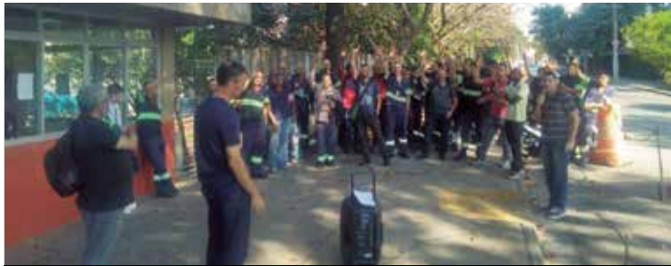
PLR na Ctrens pode chegar R$ 7 mil

Mande sua denúncia ou comentário para o nosso Whatsapp (11) 9-6078-0209.