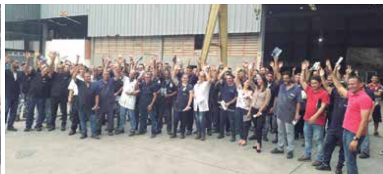
Luta por direitos aprovada na assembleia (acima) e nas portas de fábricas como Spaal e Wap (abaixo, esq. p/ dir.)

A assembleia aprovou no sábado, 21, a pauta de reivindicações da categoria na Campanha Salarial 2019. Assembleia encerrou duas semanas de intensas mobilizações nas portas de fábrica, em que o Sindicato informou os riscos e desafios da luta neste ano: se não for renovada a Convenção Coletiva, vamos ficar sujeitos à precarização imposta pelas recentes reformas na legislação trabalhista. Por isso, a categoria definiu: nossos direitos são prioridade. P.3