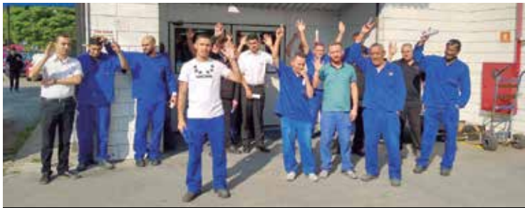
Trabalhadores da JL conquistam PLR