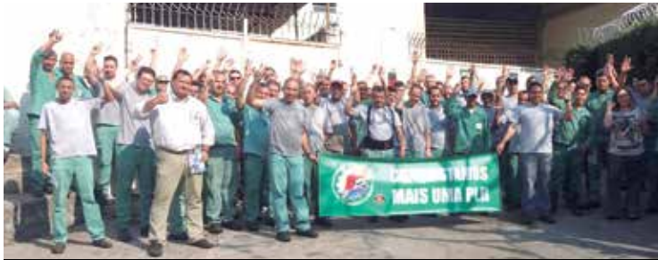
PLR garantida na Valvugas