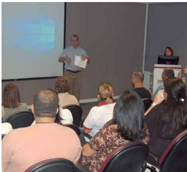
Clemente aborda índice de inclusão em metalúrgicas

Na sexta-feira, 18, o Sindicato, por meio do Espaço da Cidadania, organizou o encontro “Boas práticas da inclusão dos trabalhadores com deficiência no setor metalúrgico de Osasco e região”. Hoje seis em cada 10 metalúrgicas da região cumprem integralmente a Lei ou um pouco mais.