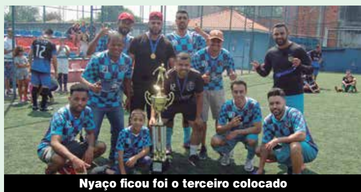
Nyao ficou foi o terceiro colocado