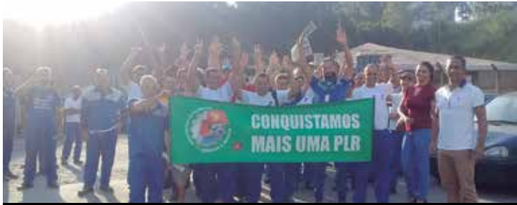
Companheiros da AEPI conquistam PLR

Também foi ampliado o número de trabalhadores com acordo de PLR. Na Ctrens, de Osasco, o valor pode chegar a R$ 7 mil. Também foi fechado acordo na Alka 3, JL, Valvugas, AEPI, Altra e Bridon conquistaram sua participação, graças a força do nosso Sindicato. Se você ainda não tem PLR, entre em contato com a gente, pelo (11) 9-6078-0209 ou diretamente com os diretores na fábrica, sede/subsedes.