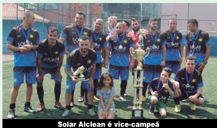
Solar Alclean é vice-campeã