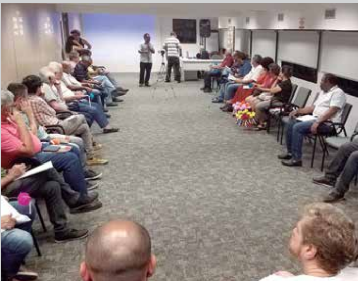
Encontro regional na sede lembrou Greve de 1979