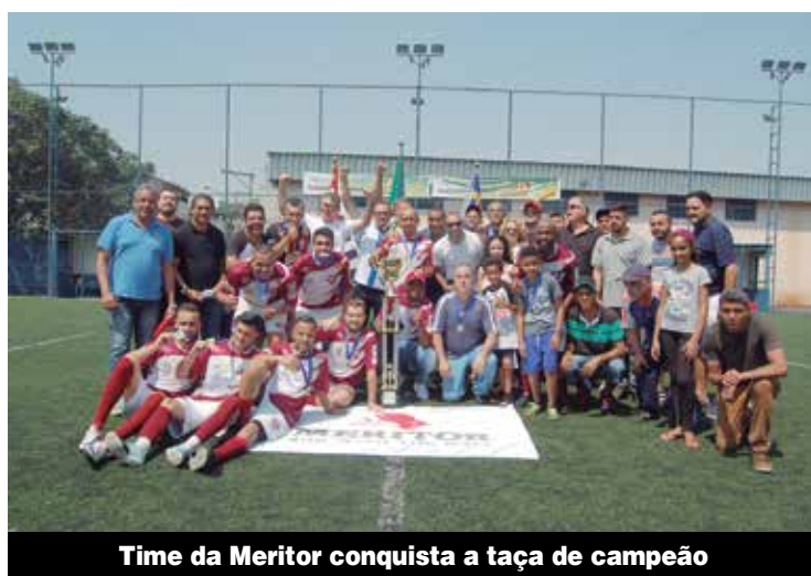
Time da Meritor conquista a taça de campeão

Os metalúrgicos da Top Taylor, de Osasco, trabalham agora 40 horas por semana, reivindicação histórica dos trabalhadores. Confira também os acordos de PLR. P.3