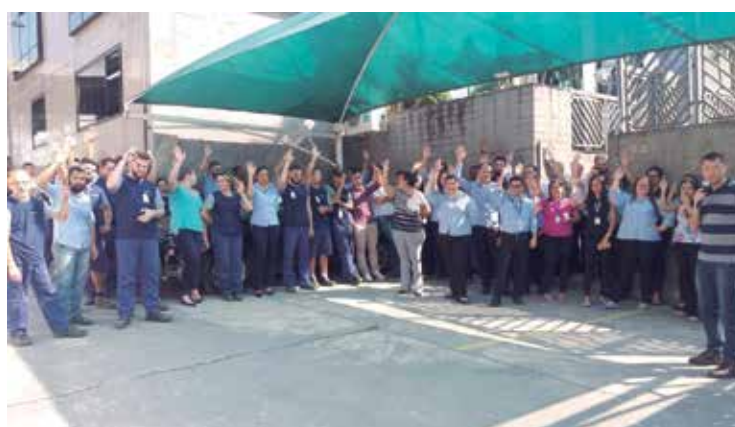
Companheiros da Top Taylor conquistam 40h