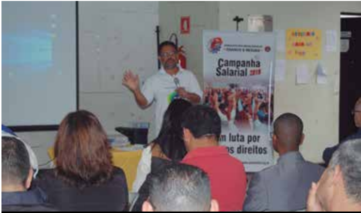
Presidente Jorge explicou vantagens da Convenção sobre a lei

da JL Capacitores completou: “A gente vem pensando em salário e vê que tem mais coisas [porque lutar]”.