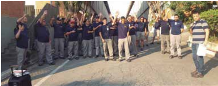
Proposta de PLR aprovada na Alka3