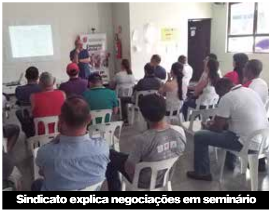
Sindicato explica negociações em seminário

endeu. “Gostei, achei bem produtivo. Eu tinha outra visão”, avaliou uma companheira de Jandira. Além dos seminários, o Sindicato também tem feito uma intensa maratona de assembleias nas portas de