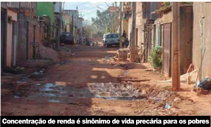
Concentração de renda é sinônimo de vida precária para os pobres

O resultado das políticas econômicas e sociais aplicadas no Brasil desde o golpe que retirou a presidenta Dilma do poder é mais concentração de renda e desigualdade. É o que podemos constatar a partir dos dados divulgados pelo IBGE na quarta-feira, 16: a renda do trabalho do 1% mais rico é quase 34 vezes maior que a metade mais pobre, são R$ 27.744 por mês contra R$ 850. O dado é referente a 2018.