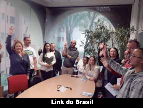
Link do Brasil

Intermed, Nuylok e WR. Se você ainda não tem PLR, informe ao Sindicato pelo 11-96078-0209 e venha lutar com a gente.