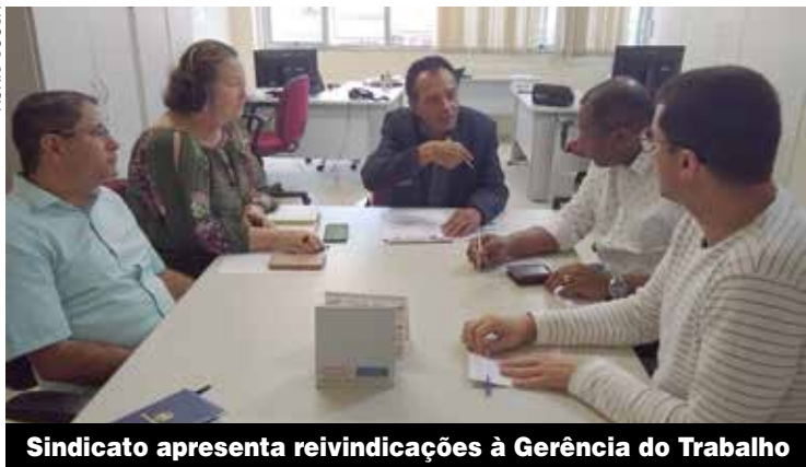
Sindicato apresenta reivindicações à Gerência do Trabalho

Com a força do nosso Sindicato, a PLR dos companheiros foi fechada. Também tem acordo na Intermed, Nylok, Link e outras. P.3