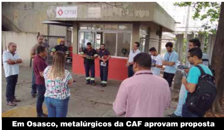
Em Osasco, metalúrgicos da CAF aprovam proposta

Exceto o G-3, demais grupos não fizeram propostas frente a nossa pauta P.3