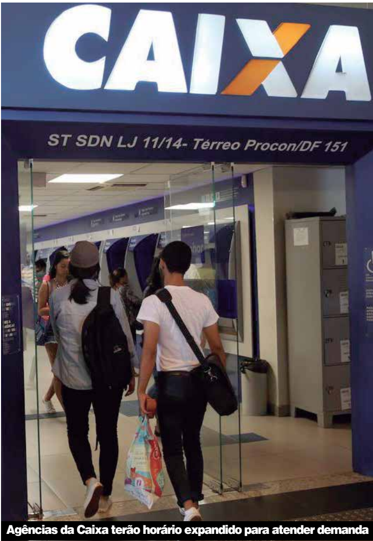
Agências da Caixa terão horário expandido para atender demanda

sua Carteira de Trabalho em mãos no momento do saque. As dúvidas sobre valores e direito ao saque podem ser consultadas no aplicativo FGTS (disponível para iOS e Android), pelo site fgts.caixa.gov.br ou pelo telefone 0800 724 2019, disponível 24 horas. A adesão a este saque não compromete o acesso do trabalhador ao saldo total do FGTS em caso de demissão sem justa causa. (fontes: Caixa e G1)