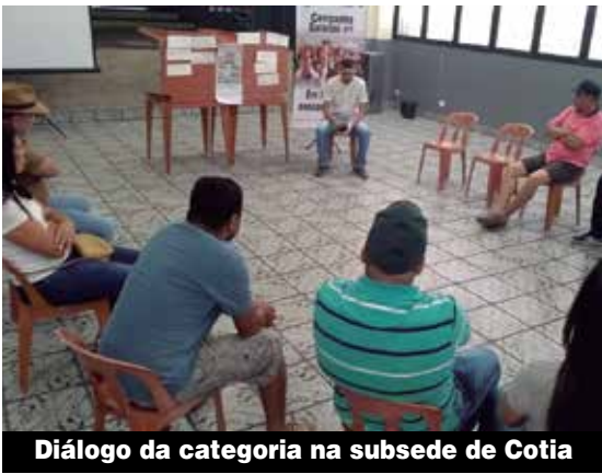
Diálogo da categoria na subsede de Cotia