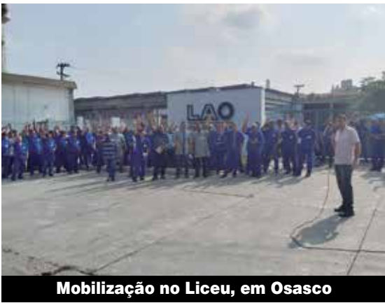
Mobilização no Liceu, em Osasco