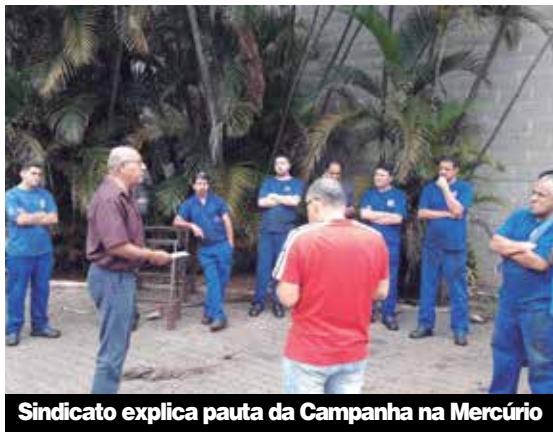
Sindicato explica pauta da Campanha na Mercúrio