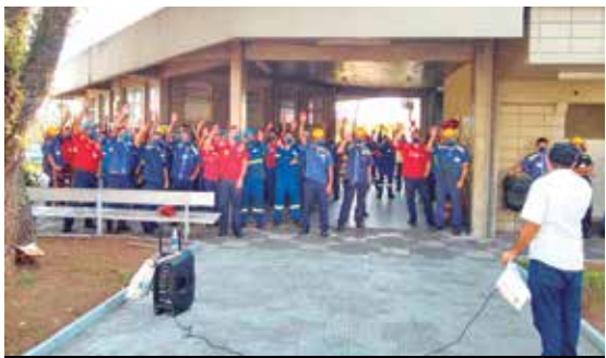
Na Bridon, PLR pode ultrapassar R$ 4 mil