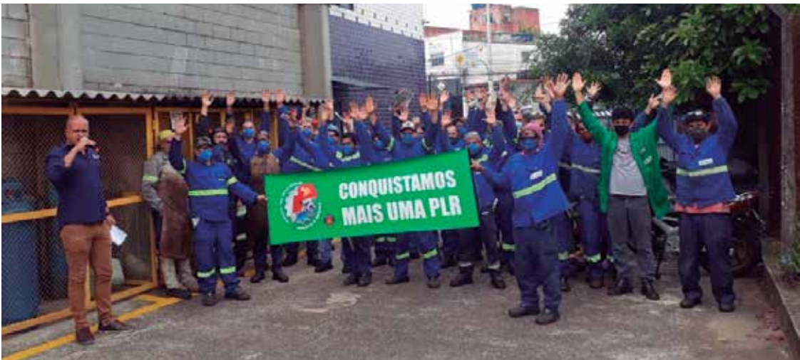
Aprovada em outubro, PLR dos companheiros da Engemtex será paga em 20/12, em parcela única

É o caso dos companheiros da: Wap Metal e Arapuxe (resgataram de 2020 e garantiram a deste ano); Multivisão (greve de um dia); Kitframe; Spaal; Metalsa; Vicon; JL Competições; Nanquim/Narayama; Southco; Construmonti, CMI, Magnamed, Alka 3, Nucotech, Alulev, Gerdau, Laminação Pasqua, Belgo, Minor, Modfer, Rossini, Freios Farj, Gramtampa/Granservice, Monteferro, Conbras, CBFA, Bimetal, Sambel, Prodec, valvugás, Brasforno, Elco, Andorinha, Dinatécnica, entre outras.