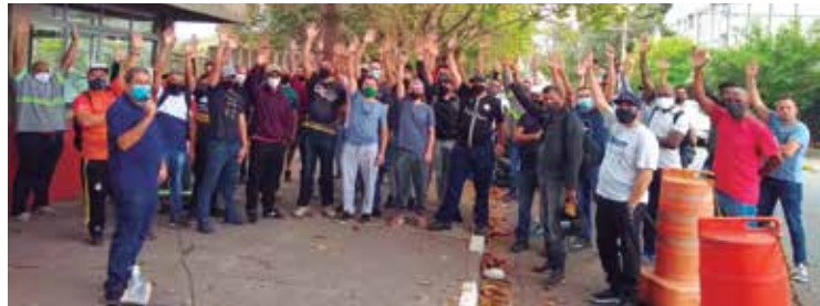
Após greve de oito dias, abono na Hyundai Rotem é de R$ 4.500

Destaque ainda para as ações com resultados favoráveis à categoria, como a qual obrigou a Feva a depositar aos trabalhadores o FGTS que estava em atraso desde 1999.