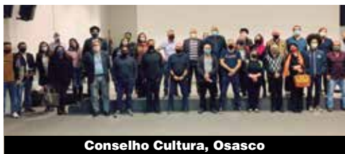
Conselho Cultural, Osasco

que destacam a entidade no movimento sindical brasileiro e internacional.