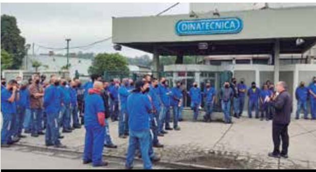
Mobilização reforçada na Dinatécnica