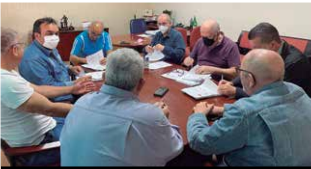
Dirigentes assinam acordos da Campanha Salarial