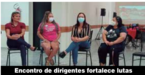
Encontro de dirigentes fortalece lutas