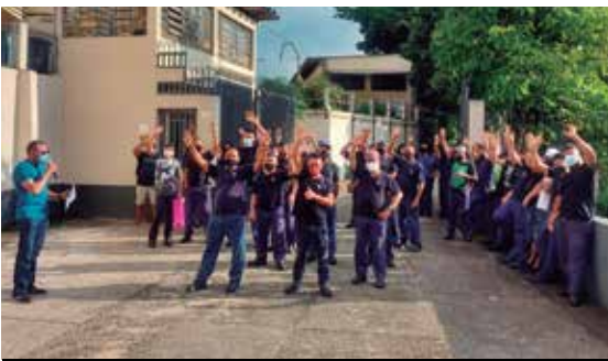
Trabalhadores da Aplic aprovam PLR