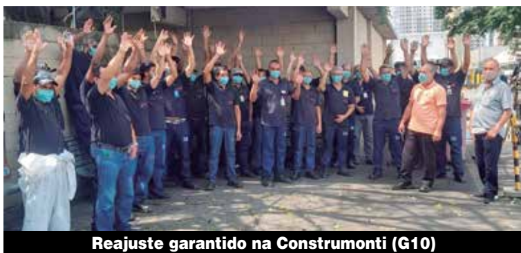
Reajuste garantido na Construmonti (G10)