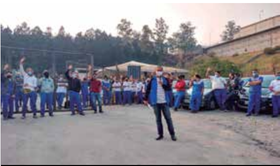
PLR da AEPI é 70% maior que a de 2020