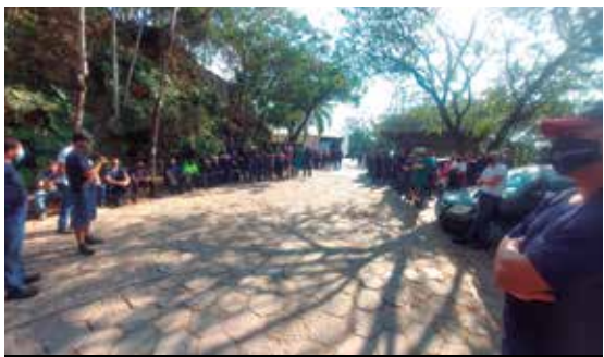
Luta na Engrecon rendeu PCS