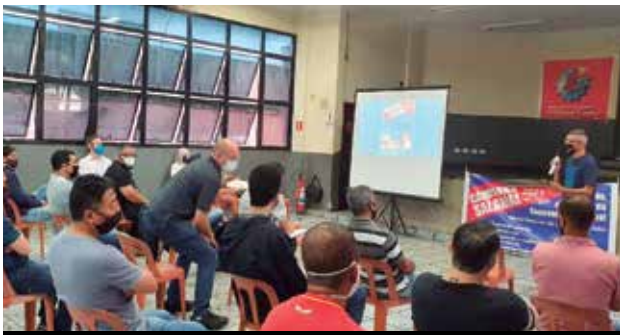
Seminário da Campanha Salarial na subsede de Cotia