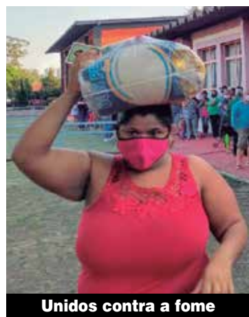
Unidos contra a fome

Retrospectiva: relembre os desafios, lutas e vitórias que marcaram o ano. Em 2022, tem muito mais, com a força da categoria.