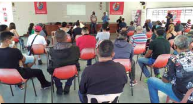
Seminário em Taboão da Serra