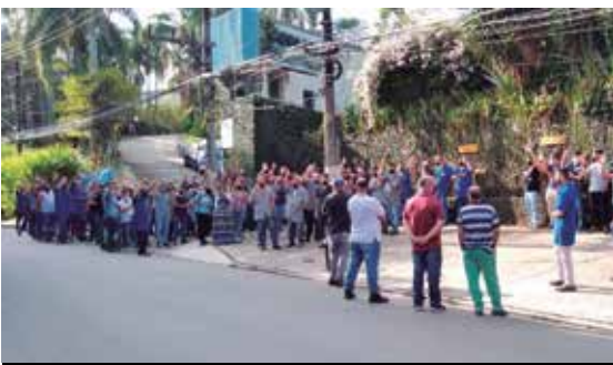
PLR garantida na Krohne/Conaut