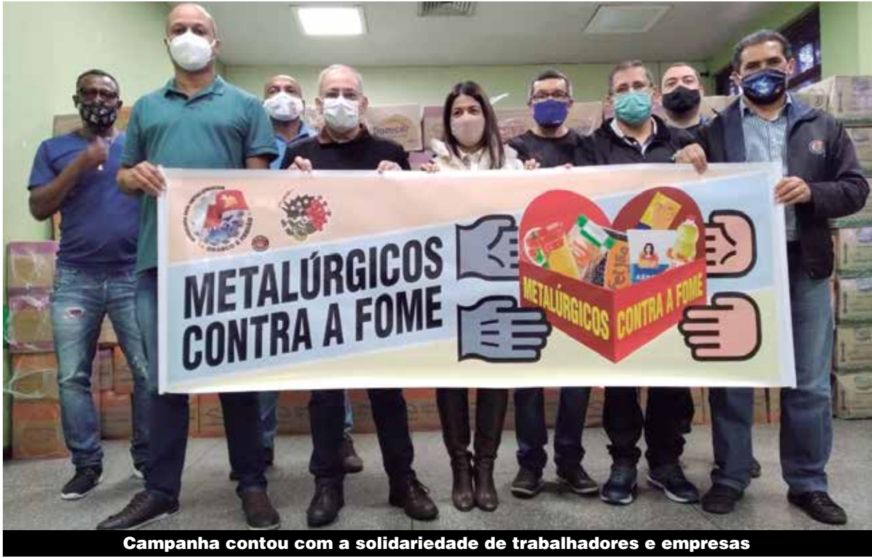
Campanha contou com a solidariedade de trabalhadores e empresas

Em quatro meses, a Campanha “Metalúrgicos contra a Fome”, distribuiu 21.262kg de alimentos em Osasco e região. Neste período, somente para as famílias do Rochdale, em Osasco, foram entregues quase 200 cestas que beneficiaram 721 pessoas.