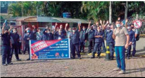
Mobilização reforçada na Konecranes