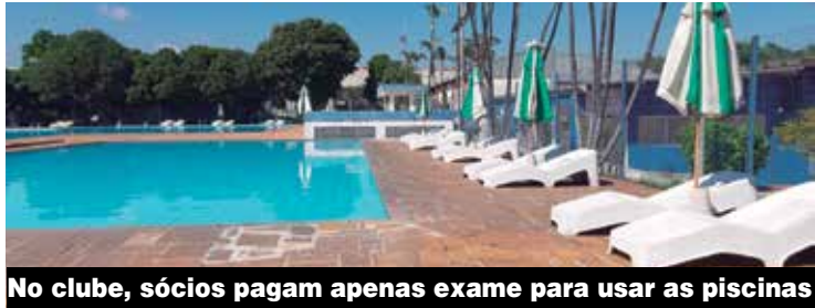
No clube, sócios pagam apenas exame para usar as piscinas