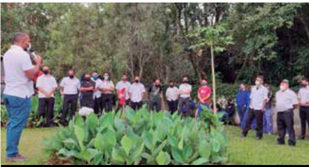
Acordo Coletivo conquistado no Grupo JL (G10)