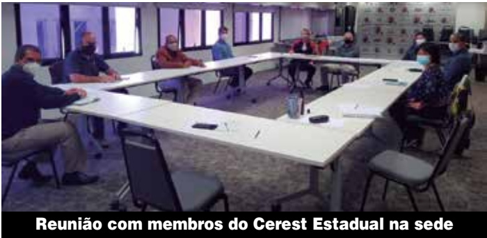
Reunião com membros do Cerest Estadual na sede