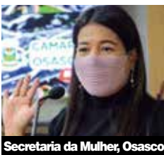
Secretaria da Mulher, Osasco