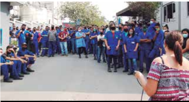
Mobilização da Campanha na Arim