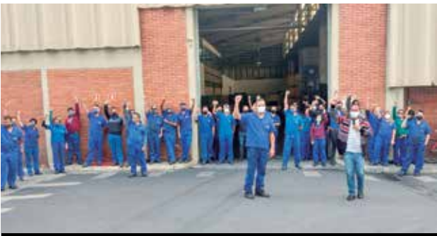
Assembleia da Campanha na Shunk