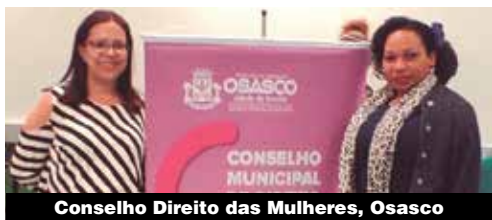
Conselho Direto das Mulheres, Osasco