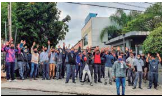
PLR e reajuste do VA na Kitframe