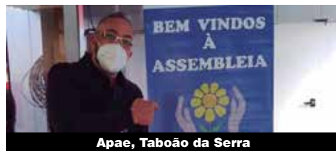
Apae, Taboão da Serra