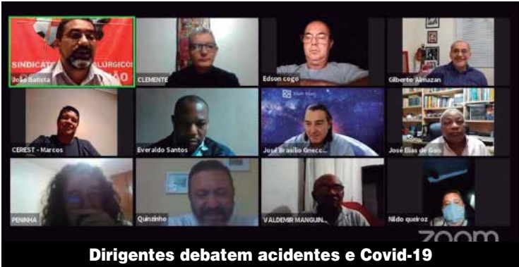
Dirigentes debatem acidentes e Covid-19