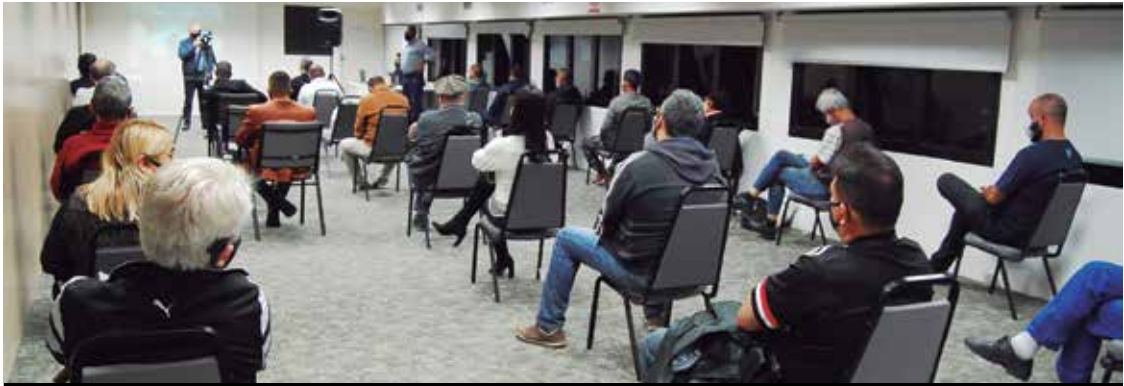
Ato político na sede, com transmissão ao vivo, marcou os 58 anos do Sindicato

trabalhadores, resgataram os principais momentos da grande greve, que aconteceu em 17 de julho de 1968, e saudaram os 58 anos do Sindicato.