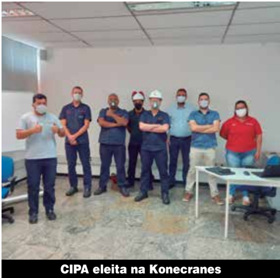
CIPA eleita na Konecranes