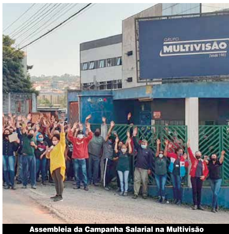
Assembleia da Campanha Salarial na Multivisão