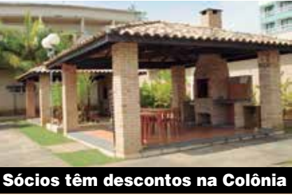
Sócios têm descontos na Colônia

Faça já a sua reserva. Mas corra porque as vagas são limitadas!