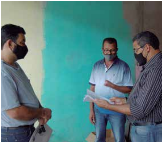
Vítima de acidente na Isocab com diretores