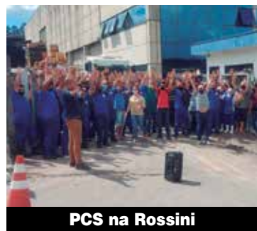
PCS na Rossini