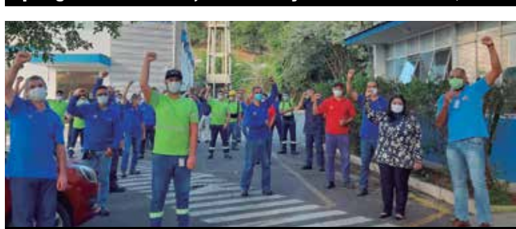
Metalúrgicos da Spirax Sarco conquistam mais de R$ 6 mil de PLR