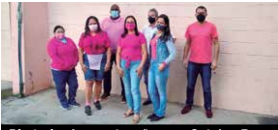
Diretoria chama atenção para Outubro Rosa