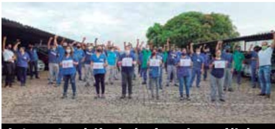
Luta contra violência é reforçada nas fábricas