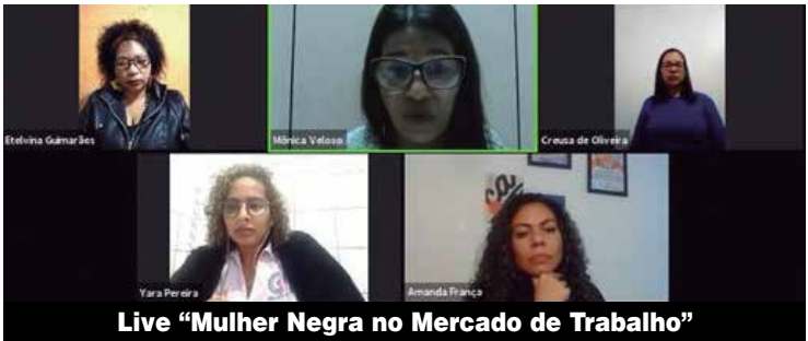
Live “Mulher Negra no Mercado de Trabalho”

Negra no Mercado de Trabalho” ou nas ações do Sindicato, que não mede esforços para valorizar e defender os direitos das trabalhadoras. Bem como conscientizar a categoria para fortalecer a luta pelo fim da violência contra as mulheres.