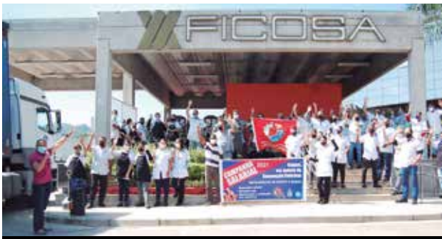
Assembleia da Campanha na Ficosa