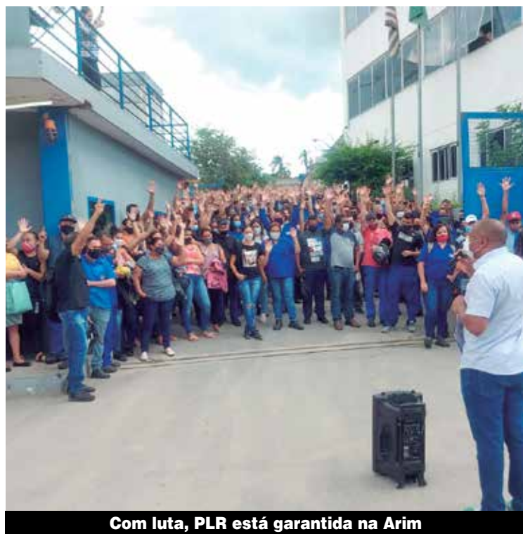
Com luta, PLR está garantida na Arim