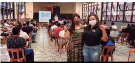
Mulheres conquistam direitos na Convenção