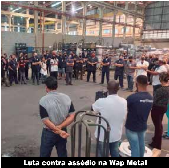
Luta contra assédio na Wap Metal