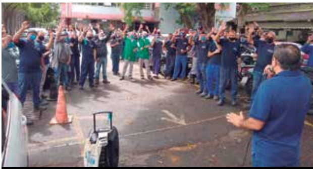
Reajuste garantido na CBFA (Grupo 10)