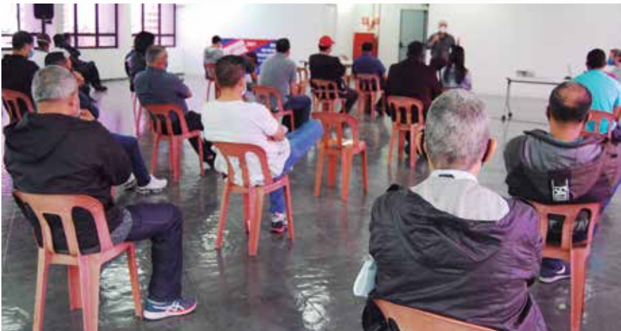
Seminário da Campanha Salarial na sede, em Osasco

Luta continua – Os companheiros e companheiras dos setores que não fecharam acordo devem se manter mobilizados com o Sindicato, para que novos acordos sejam fechados. É o caso dos companheiros do Grupo 10, Artefatos de Metais (Siamfesp), Condutores Elétricos (Sindicel) e Refrigeração, Aquecimento e Tratamento de Ar (Sindratar). A mobilização dos trabalhadores com o Sindicato, que tem negociado direto com as empresas, já rendeu acordos em diversas fábricas, como Metalforja, Nascim, CBFA, Grupo JL, Construmonti, Hidrometer, Little House e Frigostrella.