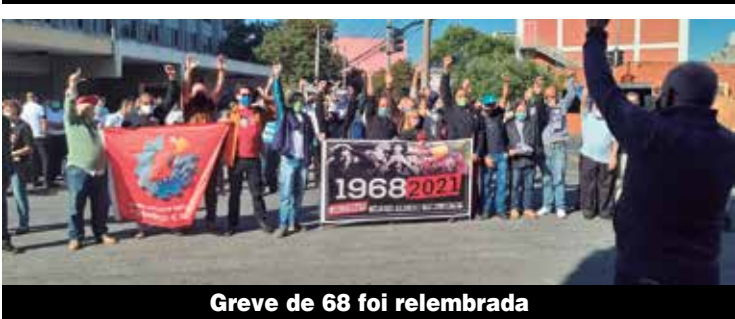
Greve de 68 foi lembrada