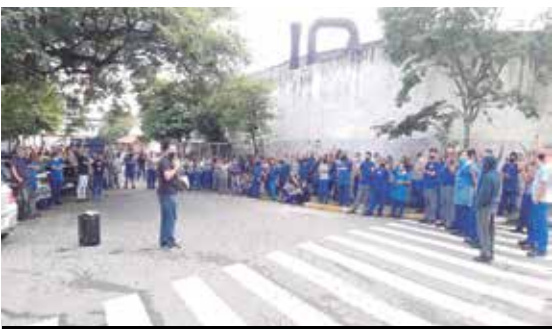
PLR conquistada na Nanquim/Narayama