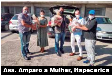
Ass. Amparo a Mulher, Itapeceira