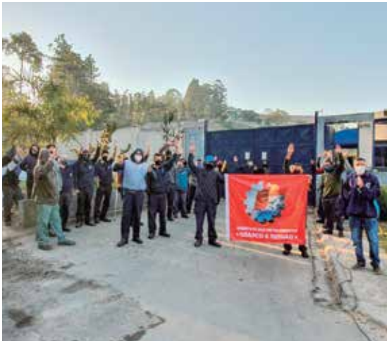
Luta contra acidente na New Oldany