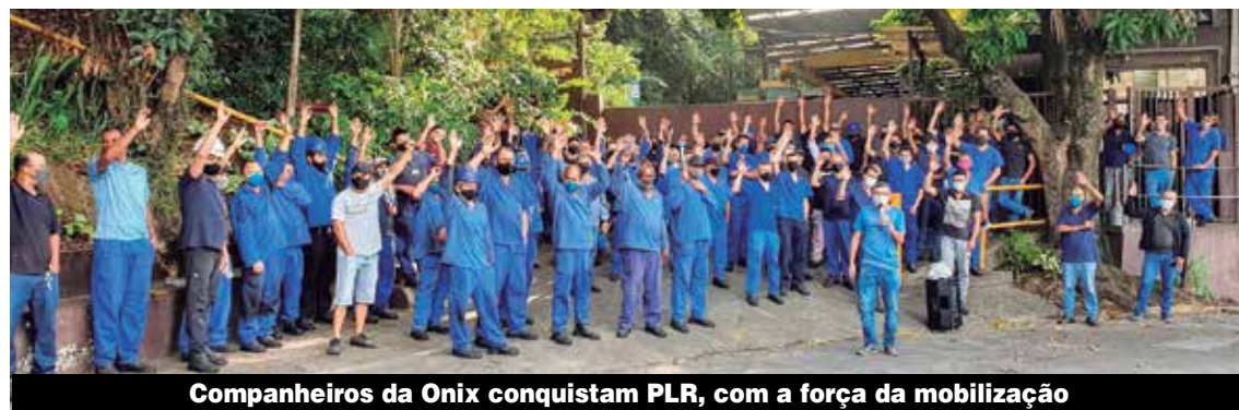
Companheiros da Onix conquistam PLR, com a força da mobilização