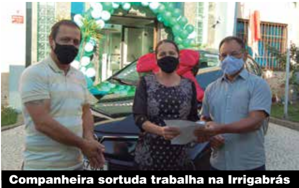
Companheira sortuda trabalha na Irrigabrás

Para participar, bastava ser associado e adquirir alguns produtos oferecidos pela cooperativa, como os cartões de débito e crédito, maquininhas, poupança, entre outros. Cada vez que isso acontecia, automaticamente o cooperado ganhava números da sorte para concorrer aos prêmios que seguem os sorteios da Loteria Federal.