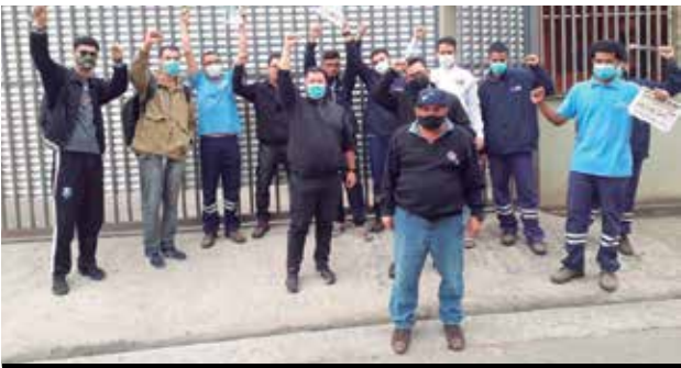
Assembleia da Campanha da Nucotech