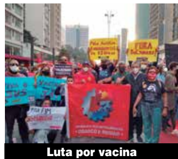
Luta por vacina