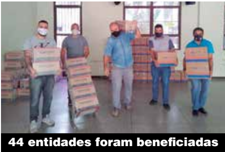
44 entidades foram beneficiadas