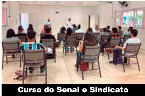
Curso do Senai e Sindicato