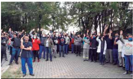
Mobilização na Prodec garante PLR