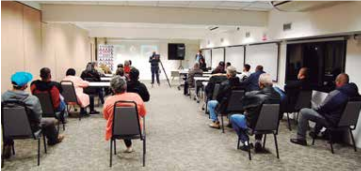
Ciclo de Debates faz homenagem às vítimas da Covid-19

do trabalho também nortearam os debates, e foi tema de destaque do 42º Ciclo de Debates, que aconteceu simultaneamente na sede, na subsele de Taboão, com transmissão no Facebook do Sindicato.