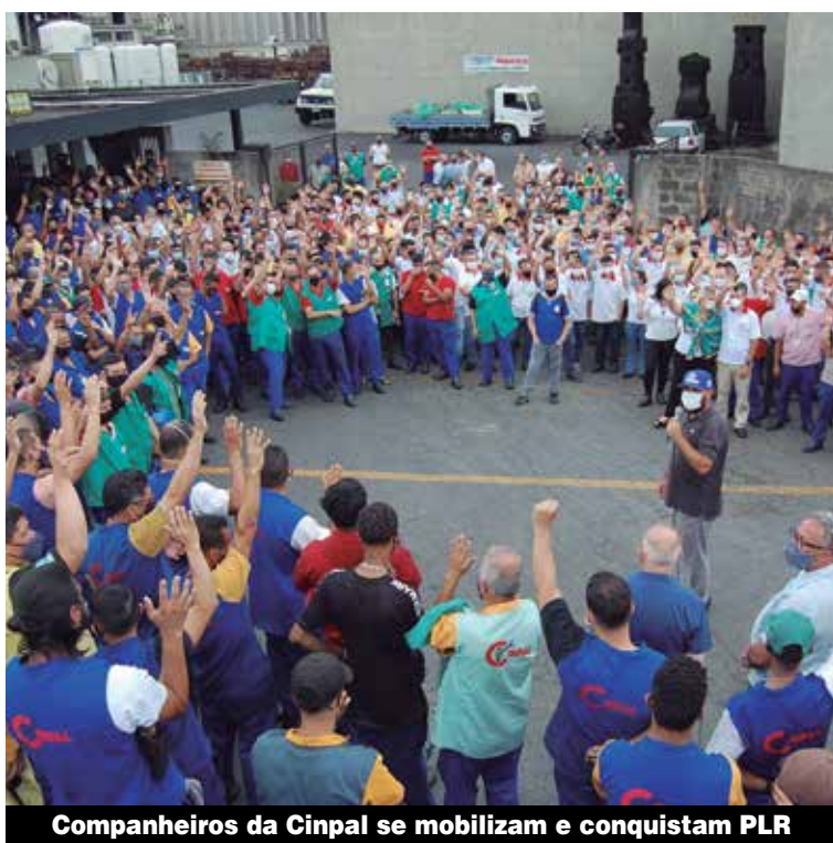
Companheiros da Cinpal se mobilizam e conquistam PLR