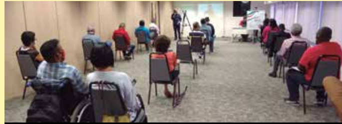
Divulgação da Pesquisa Metalúrgica sobre inclusão