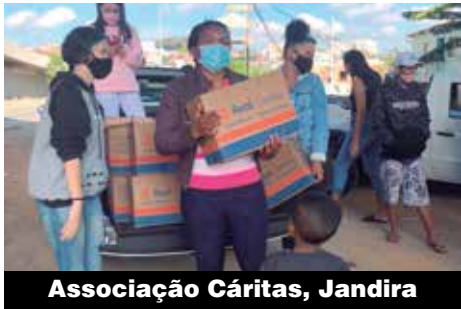
Associação Cáritas, Jandira

As aulas foram ministradas pelo Senai no Metalclub. Para o próximo ano, o objetivo da diretoria é manter estes cursos e ampliar o número de participantes, para que mais pessoas sejam beneficiadas.