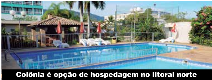
Colônia é opção de hospedagem no litoral norte

CLUBES – Para o lazer, a família metalúrgica também tem na região, o Metalclub, em Osasco, e o Metalcamp, em Cotia. Sócios pagam apenas o exame para utilizar as piscinas. No Metalclub, o sócio tem descontos para usufruir de outros atrativos, como academia e natação.