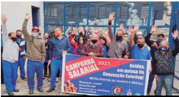
Unidade pela Campanha na Wegflex