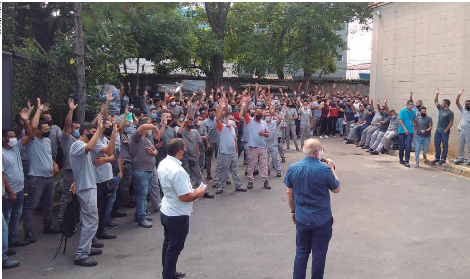
Junto com o Sindicato, metalúrgicos da Luminae conquistam acordo graças a negociação direta com a empresa