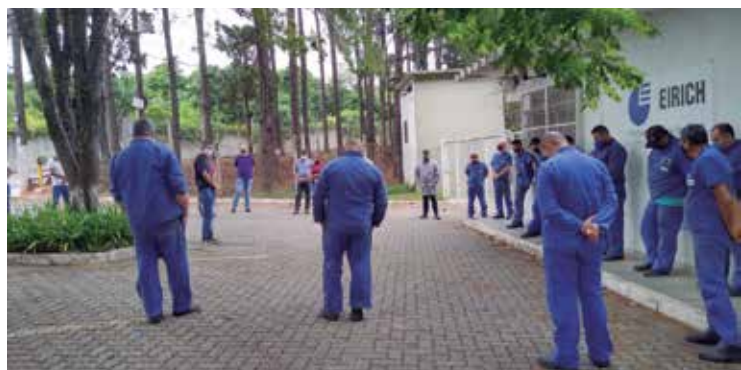
Trabalhadores fazem um minuto de silêncio na Eirich

A organização dos metalúrgicos com o Sindicato tem resultado em mais acordos de PLR, a luta é para que este direito chegue a mais trabalhadores P.3