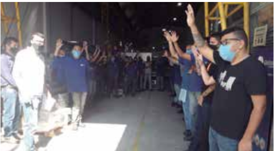
Unidade garante PLR na Rematec