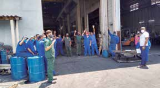
PLR fechada na Metaltecnica