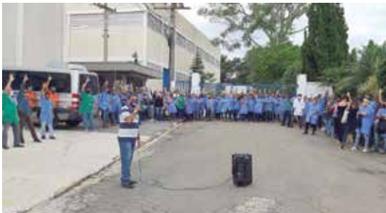
Companheiros da Orgus conquistam PLR

que as empresas melhorassem as propostas. A PLR é um direito que para ser respeitado precisa da cobrança e da pressão dos trabalhadores, junto ao Sindicato. Se você ainda não tem, organize os companheiros e venha para a luta!