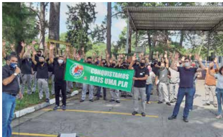
Com apoio do Sindicato, PLR é conquistada na Bitzer

Fim da produção da montadora vai prejudicar 118.864 mil postos de trabalho P.3