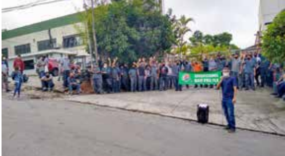
PLR também conquistada na Kitframe