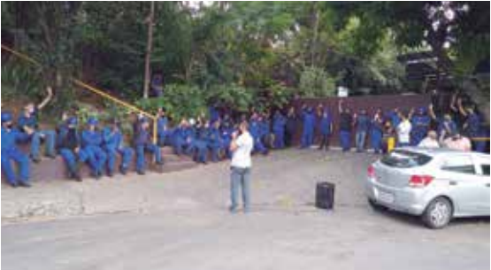
João coloca PLR em votação na Onix

Mande sua denúncia para o nosso Whatsapp (11) 9-6078-0209. Informe o nome da empresa.