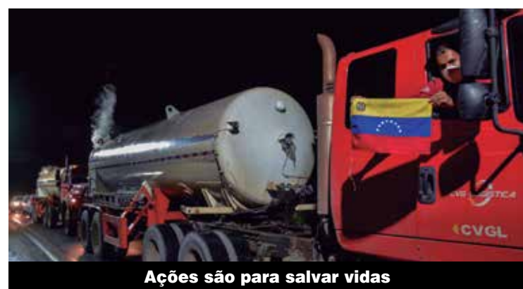
Ações são para salvar vidas

Aposentados reivindicam direitos para categoria P.2