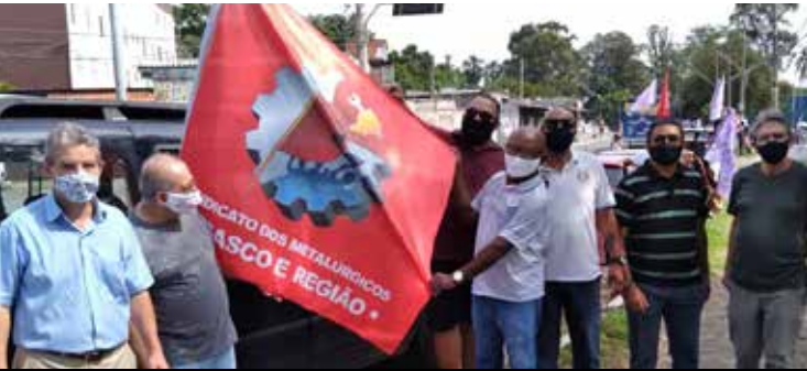
Diretoria participou de carreata que partiu de Carapicuíba

no parque dos Paturis, em Carapicuíba, de onde a carreata saiu em direção ao Largo de Osasco. Chamada pelas Frentes Brasil Popular e Povo Sem Medo, a carreata também pediu o impeachment de Bolsonaro, que nega a gravidade da covid-19, a ciência e ataca até a esperança das vacinas. Com as mortes por covid-19 passando dos 215 mil e o desemprego atingindo 14 milhões de pessoas no Brasil, a carreata que aconteceu em vários lugares do país chamou a atenção da população para o descaso instalado no nosso país. Enquanto isso, Bolsonaro diz: “O Brasil está quebrado e eu não posso fazer nada”.