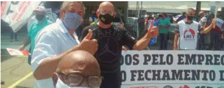
Diretoria presente em ato contra o fim da produção da Ford no Brasil