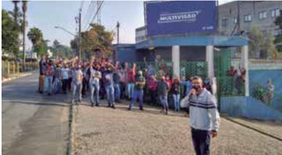
Após greve, sai PLR na Multivisão