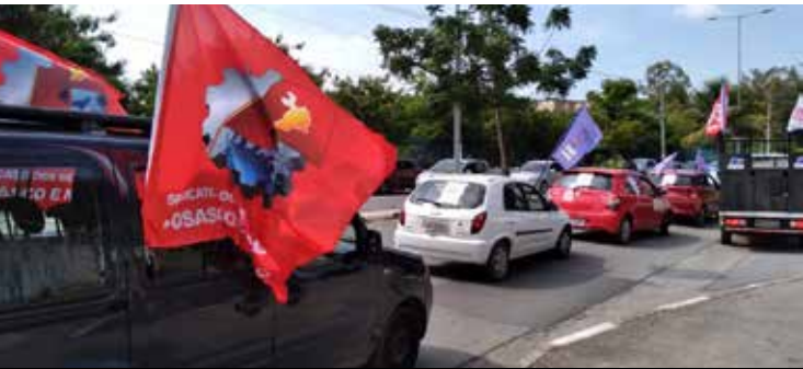
Carreata pediu por vacina e retorno do auxílio emergencial

Dúvidas: auris.imprensa@sindmetal.org.br