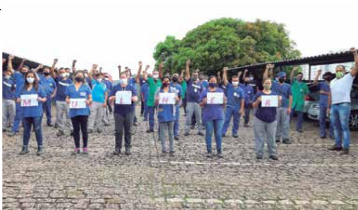
Na CrisMetal, a luta por igualdade está reforçada