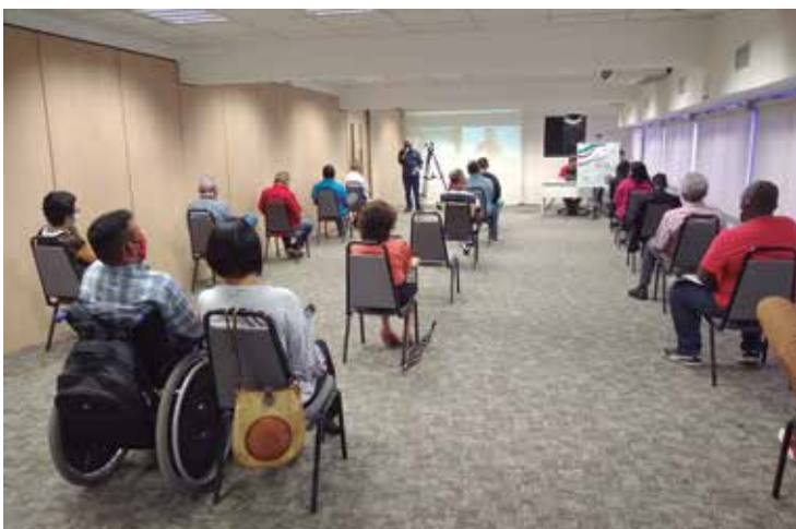
Pesquisa mostra que pandemia prejudicou a inclusão