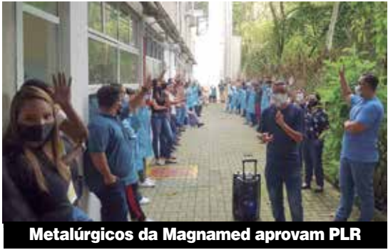
Metalúrgicos da Magnamed aprovam PLR