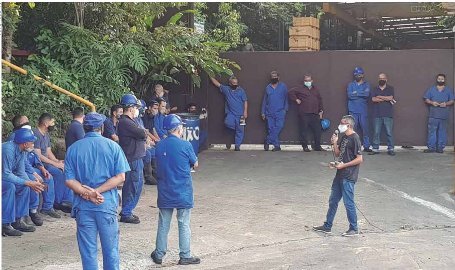
Companheiros da Onix estão entre os trabalhadores que reforçaram a mobilização por emprego e Vacina Já!