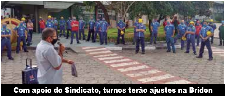
Com apoio do Sindicato, turnos terão ajustes na Bridon

Na Bridon, assembleia realizada na quarta-feira, 3, tratou de ajustes nos turnos dos companheiros. A partir de abril, uma turma vai começar a trabalhar das 14h às 23h, de segunda a sexta, e outra das 6h40 às 16h40, de segunda a quinta, as sextas o horário será das 6h40 até 15h40.