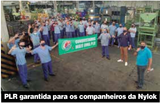
PLR garantida para os companheiros da Nylok

do Sindicato, os trabalhadores da Magnamed e Nylok conquistaram PLR referente a 2020.