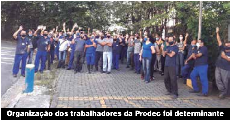
Organização dos trabalhadores da Prodec foi determinante