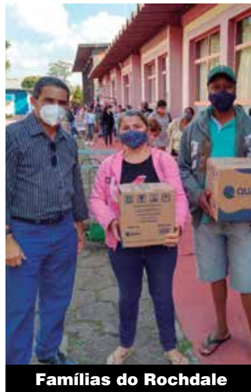
Famílias do Rochdale