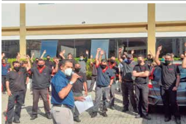
PLR na Modefer