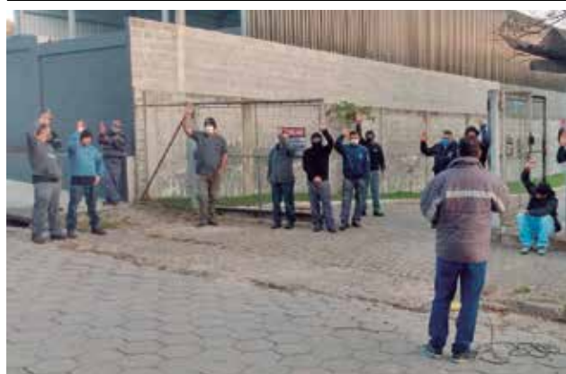
PLR na Minor