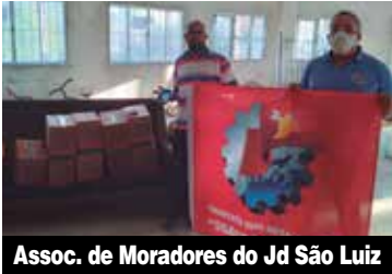
Assoc. de Moradores do Jd São Luiz

“Esta campanha se insere em um conjunto amplo de iniciativas do Sindicato em vários campos, sendo mais um meio de colaboração da entidade com a sociedade e classe trabalhadora. Seja no que se refere a defesa dos direitos da categoria, na articulação com especialistas e órgãos competentes para preservar a saúde dos trabalhadores, seja em campanhas que levam o bem para o próximo”, ressalta.