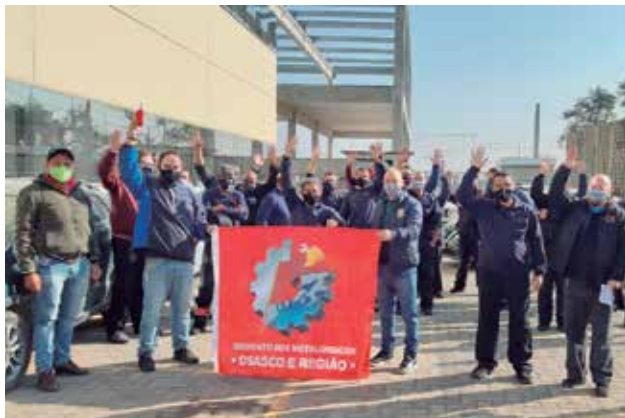
PLR na Altra