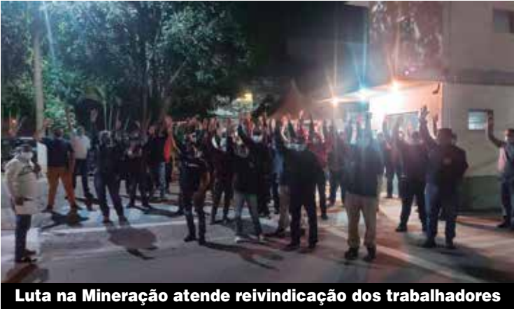
Luta na Mineração atende reivindicação dos trabalhadores

Em dois dias de assembleias, 7 e 8 de julho, os metalúrgicos da Mineração Taboca decidiram pelo retorno da cesta básica física que inclui, além de alimentos, materiais de limpeza e de higiene pessoal. A decisão atende a uma reivindicação dos companheiros, que não ficaram satisfeitos quando, sem consultar os trabalhadores, a empresa substituiu os itens por uma cesta cartão.