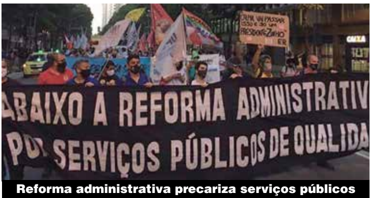
Reforma administrativa precariza serviços públicos