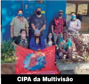
CIPA da Multivisão

Em dois dias de assembleias, 7 e 8 de julho, os metalúrgicos da Mineração Taboca decidiram pelo retorno da cesta básica física que inclui, além de alimentos, materiais de limpeza e de higiene pessoal. A decisão atende a uma reivindicação dos companheiros, que não ficaram satisfeitos quando, sem consultar os trabalhadores, a empresa substituiu os itens por uma cesta cartão.