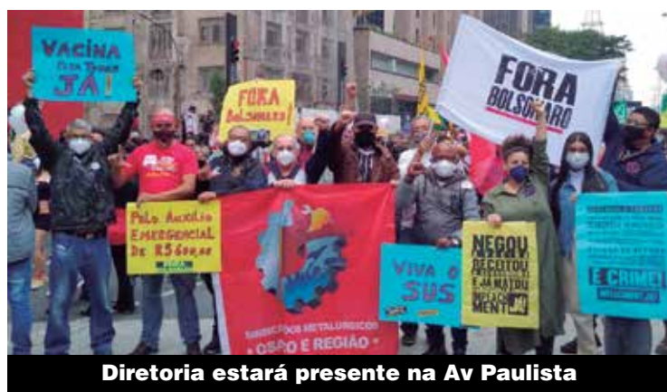
Diretoria estará presente na Av Paulista

Diretoria promove Live Comemorativa com resgate histórico, contextualização atual e perspectivas para o futuro. Vídeos de lideranças do movimento sindical e da política vão marcar a semana de aniversário P. 3