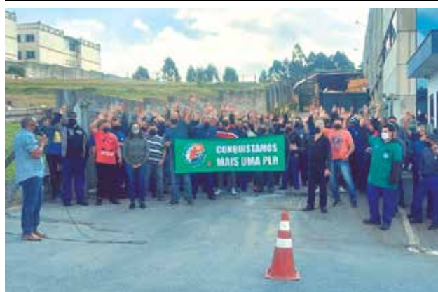
PLR na Rossini