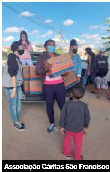
Associação Cáritas São Francisco