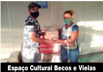
Espaço Cultural Becos e Vieiras