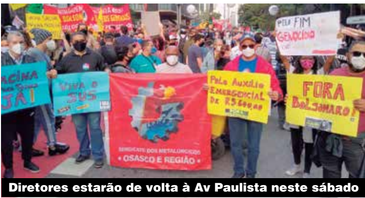
Diretores estarão de volta à Av Paulista neste sábado

Nós não podemos aceitar mais esse governo corrupto, incompetente e genocida. É hora de dizer basta! É hora de ir às ruas!