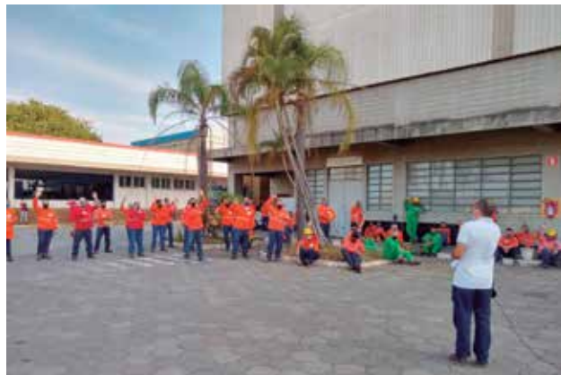
PLR na Belgo Arames