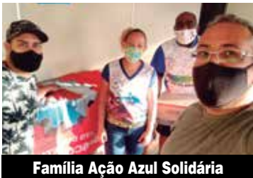
Família Ação Azul Solidária