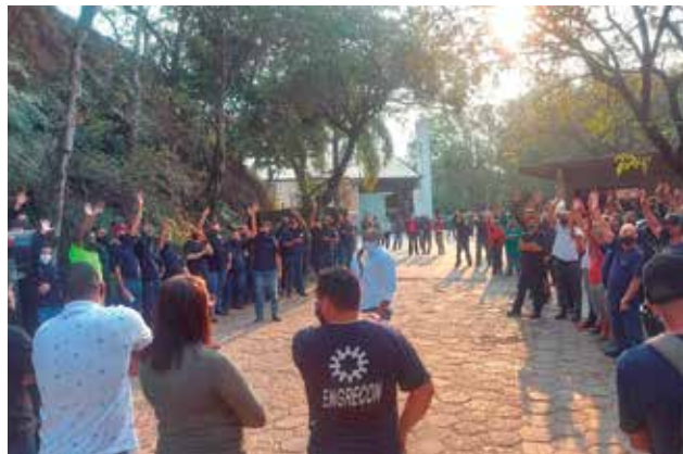
Estado de greve na Engrecon

Metalúrgicos conquistam PLR e fortalecem organização na região P. 4