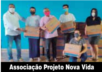
Associação Projeto Nova Vida